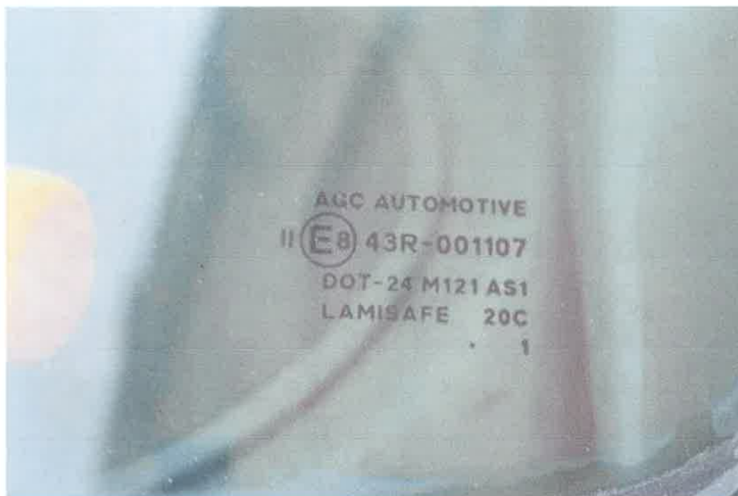
22 Szyba czołowa.