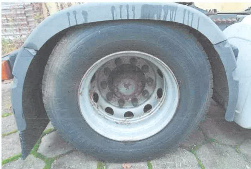
20 Koło tylne prawe.