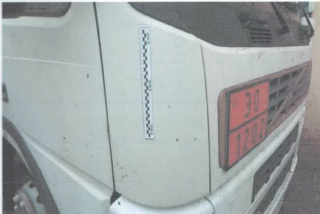
23 Narożnik przedni prawy, pokrywa przednia.