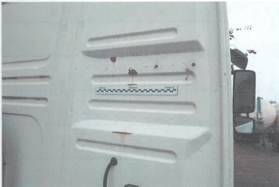
29 Ściana tylna.