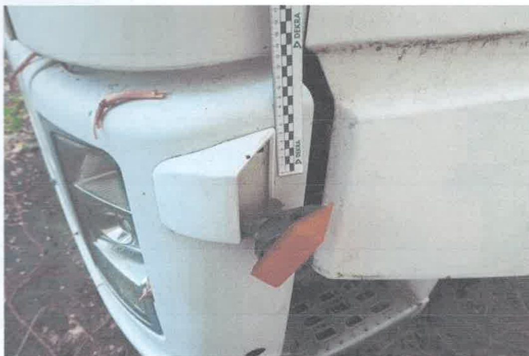
26 Kierunkowskaz boczny lewy.