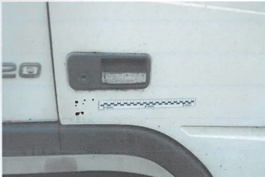
31 Drzwi prawe.