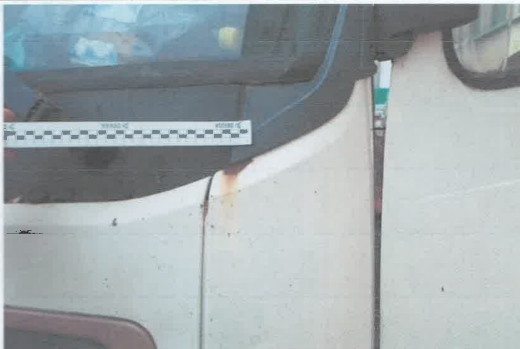
25 Naróżnik przedni lewy, pokrywa przednia.