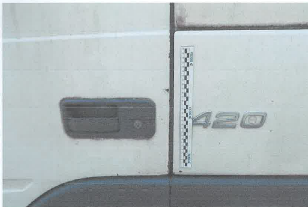
28 Drzwi lewe.