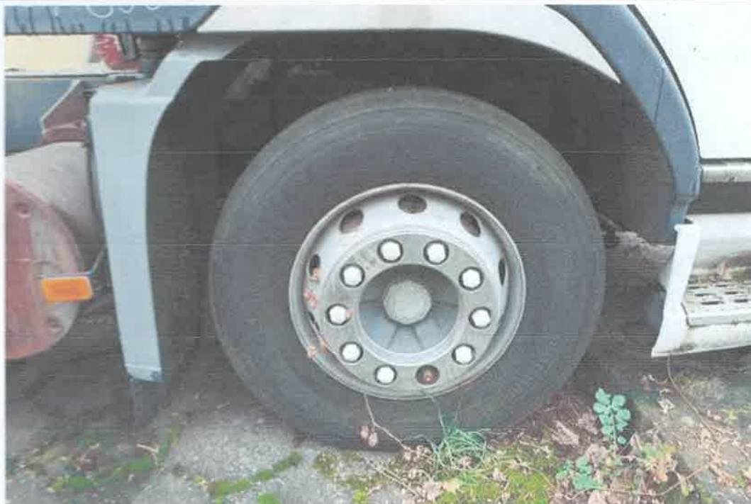
21 Koło przednie prawe.