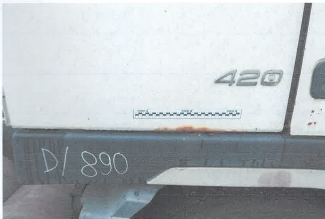
30 Ściana boczna prawa.