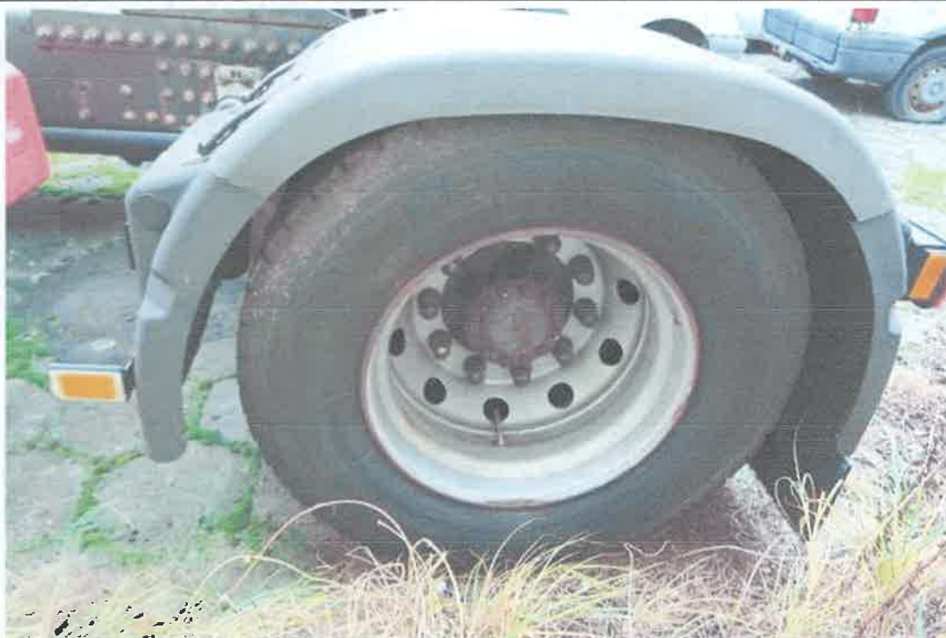
19 Koło tylne lewe.