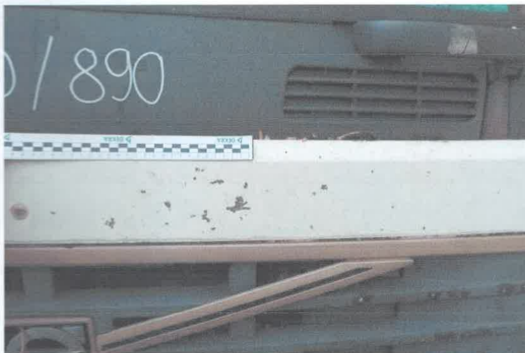
24 Pokrywa przednia.